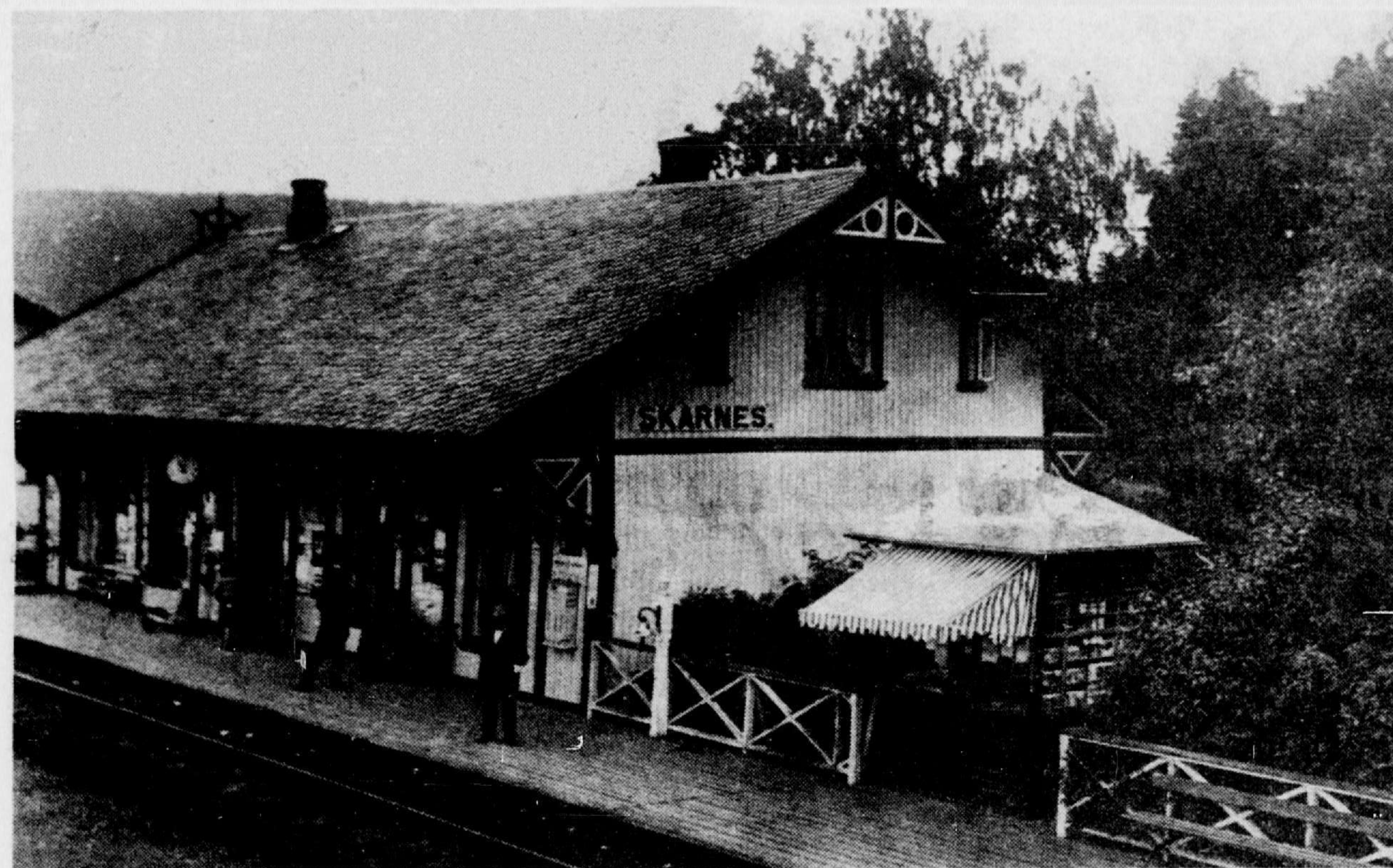
Skarnes jernbanestasjon. Forandringene er ikke store fram til i dag når det gjelder bygningens utseende.