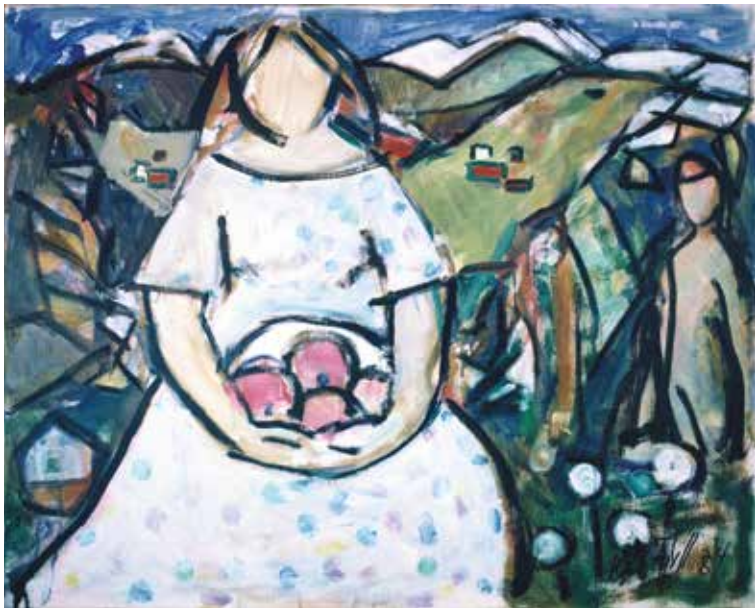
Kai Fjell: "Fruktfattet", 1984, olje/lerret, 80 x 100 cm