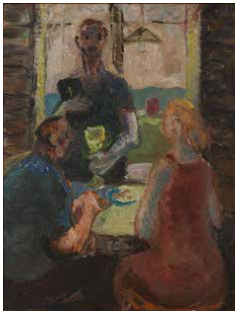
Kåre Tveter, "Budskapet", ca 1950-52, 34x26 cm