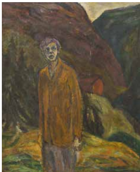
Kåre Tveter, "I dalen", ca 1950-54, 45x37 cm