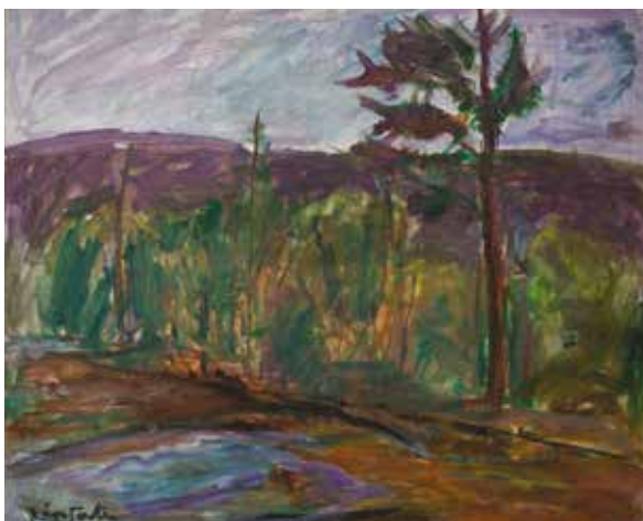
Kåre Tveter, "Mot høst", ca 1955, 37x45 cm