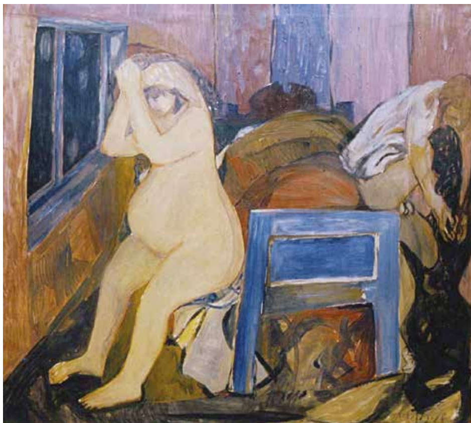
Kai Fjell: "Jordmorbud", 1949, olje/lerret, 100x108 cm

koloristiske virkningen av mannens oker - sienna fargede jakke mot alt det grønne og blå i grantrærne og de stupbratte fjellsidene i bakgrunnen. Den rødbrune bygningen midt på bildet balanserer komposisjonen, som et nav i et hjul. Tveters figurative bilder har sin styrke i koloritt og komposisjon og ikke i fortellingen. Her kommer den store forskjellen mellom de to malerne til uttrykk og det er talende at mens Fjell fikk sitt gjennombrudd i sterkt følelseladde fortellende bilder, fikk Tveter først sitt gjennombrudd når han la fortellingen til side. Tveters posisjon som maler hvilte i hans egen generasjon på at han etter hvert