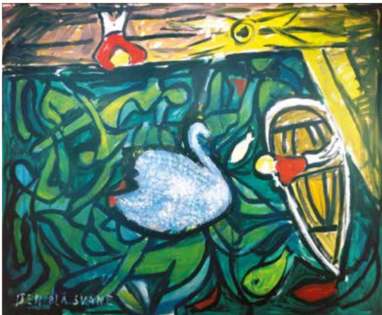
Kai Fjell: "Den blå svane", 1988, olje/lerret, 80x100 cm