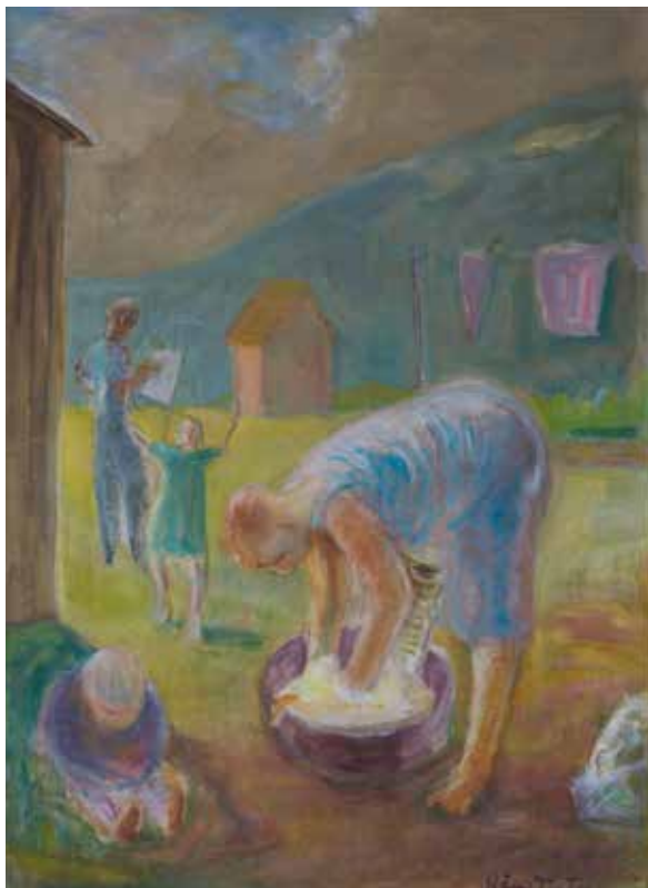
Kåre Tveter, "Sommerdag på tunet", 1955, 67x50 cm