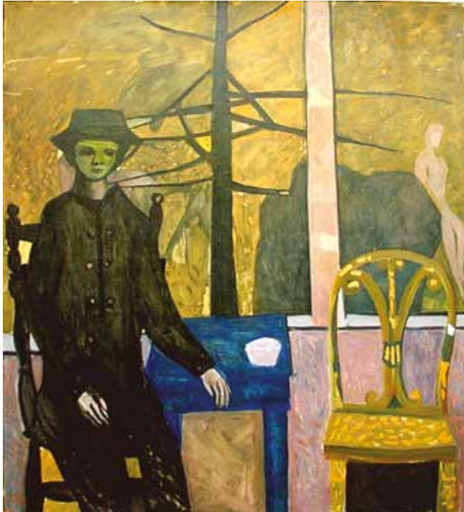
Kai Fjell: "Ventende mann", 1954, olje/lerret, 145x130 cm

i naturmotiver forenkler og konsentrerer seg om noen få hovedformer og dominerende koloristiske temaer. Han fikk en posisjon i første rekke blant modernistiske naturlyriske norske malere gjennom bilder som løfter frem fargene og lysets stemningsskapende virkninger med en utpreget sans for motivenes stofflige overflatevirkninger.