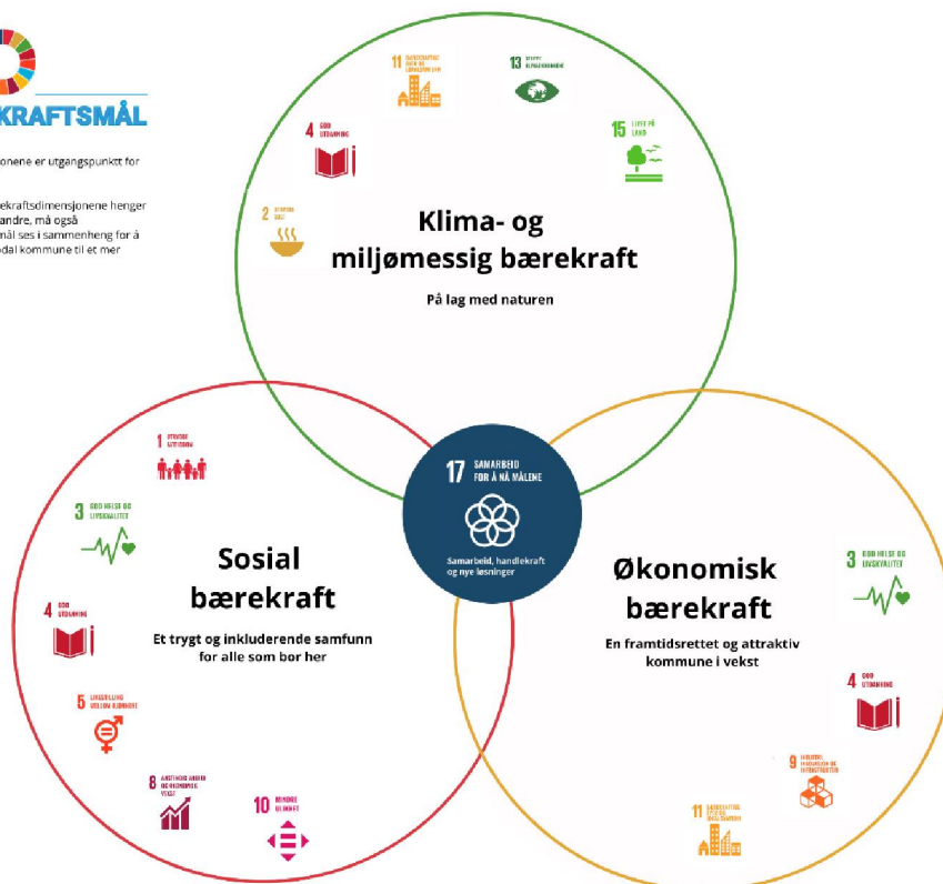
Figur 3: Figuren viser hvordan kommunens satsingsområder ses i sammenheng med FNs bærekraftsmål.

På samme måte som bærekraftsdimensjonene henger sammen og påvirker hverandre, må også kommuneplanens hovedmål ses i sammenheng for å lykkes med å utvikle Sør-odal kommune til et mer bærekraftig samfunn.